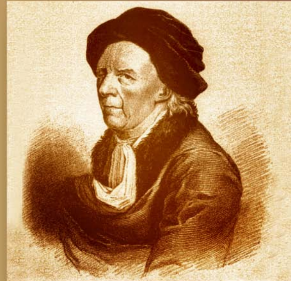
Leonhard Euler (1707 - 1783)

"Αν και δεν έχουμε τη δυνατότητα να διεκδύσουμε στο βαθύ μυστήριο της φύσης και από εκεί να μάθουμε τις αληθινές αιτίες των φαινομένων, εντούτοις, μερικές φορές συμβαίνει μια απλή υπόθεση να είναι αρκετή για να εξηγήσουμε πολλά φαινόμενα."